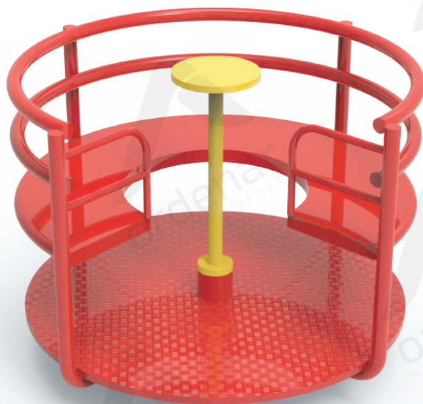
Imagen referencial. Para más información ingrese a www.ordenarmobiliario.com.ar