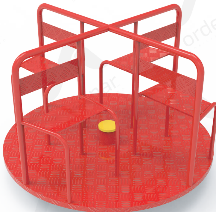
Imagen referencial. Para más información ingrese a www.ordenarmobiliario.com.ar