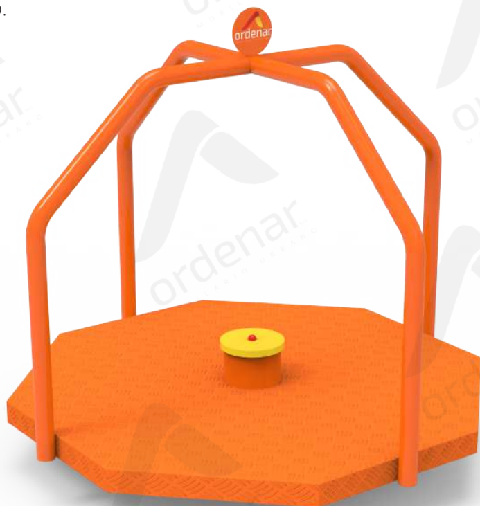
Imagen referencial. Para más información ingrese a www.ordenarmobiliario.com.ar